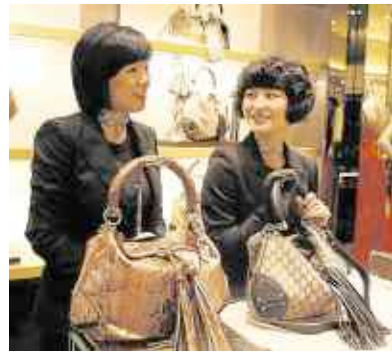
Prêtes à se ruiner ?

La classe moyenne chinoise ne se contente plus de contrefaçons. Selon une étude de CLSA (Crédit Lyonnais Securities Asia), le pays va devenir le