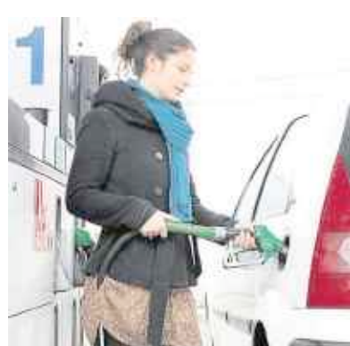
Chargement, barres de toit, conduite nerveuse... pèsent sur la consommation d'essence.

Oui. La climatisation nécessite 0,6 à 0,8 litre/100 km. Ne la brancher que si vous avez un réel besoin de refroidissement à bord ou si, en hiver, vous voulez combattre la buée. Mais ne la laissez pas en permanence.